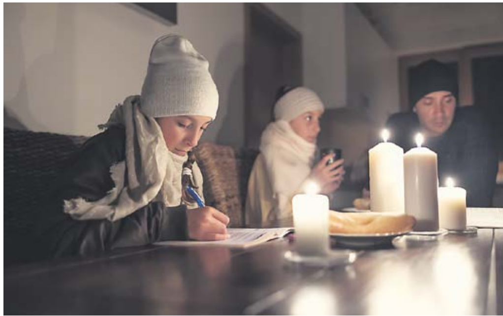
Mit Kerzen und Taschenlampen lässt sich die Zeit, bis der Strom wieder fließt, überbrücken.

Für einen länger andauernden stadtweiten Stromausfall bereits ausgerüstet sind die Feuerwehrgerätehäuser in Auerbach, Schwanheim und Gronau. Auch der Feuerwehrstützpunkt Bensheim-Mitte ist bereits für einen Blackout gewappnet, da er über einen festen Notstromgenerator verfügt.