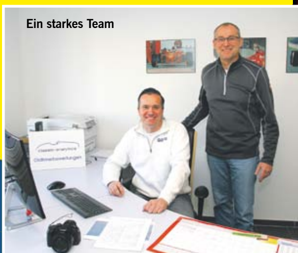
Ein starkes Team

Ihr Team an der Bergstraße, wenn es um Schaden und Bewertung geht.