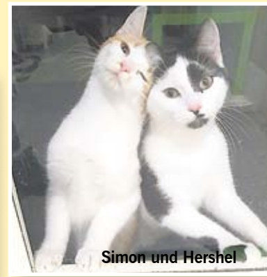
Simon und Hershel

und lustig. Wer mit ihnen ins Gespräch kommen möchte, muss etwas Geduld haben und auch viel Zeit. Es wird sich aber lohnen, denn irgendwann geben sie alle nach. Sie sind etwa 6 Monate alt, geimpft, gechipt und kastriert und könnten in ein nettes Zuhause - vielleicht ohne ganz kleine Kinder - umziehen. Am allerliebsten hätten sie später Freigang.