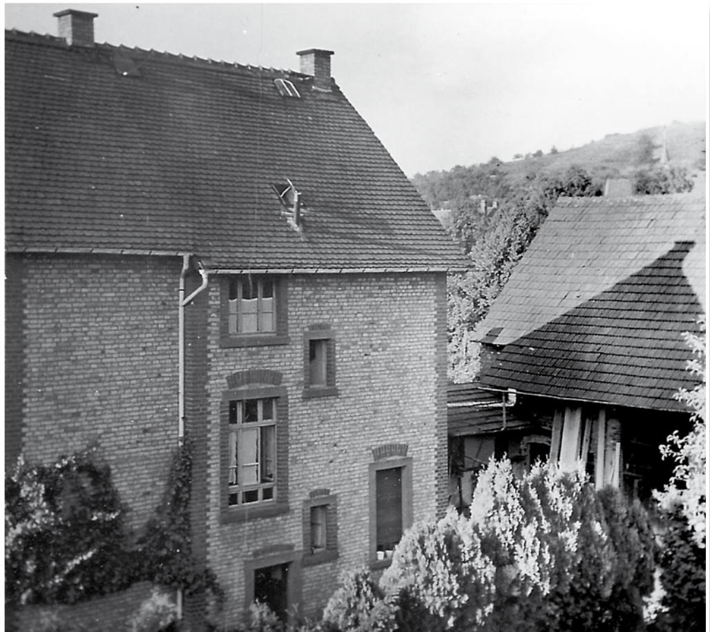
Das alte Firmengebäude der Schreinerei Schaider in der Heidelberger Straße in Bensheim. Dort wurde das Unternehmen 1925 gegründet.