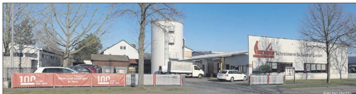
Das Firmengebäude der Firma Schaider am Berliner Ring in Bensheim wurde 1995 bezogen. Auf über 500 m² Werkstattfläche stehen dort moderne Maschinen zur Holzverarbeitung zur Verfügung.