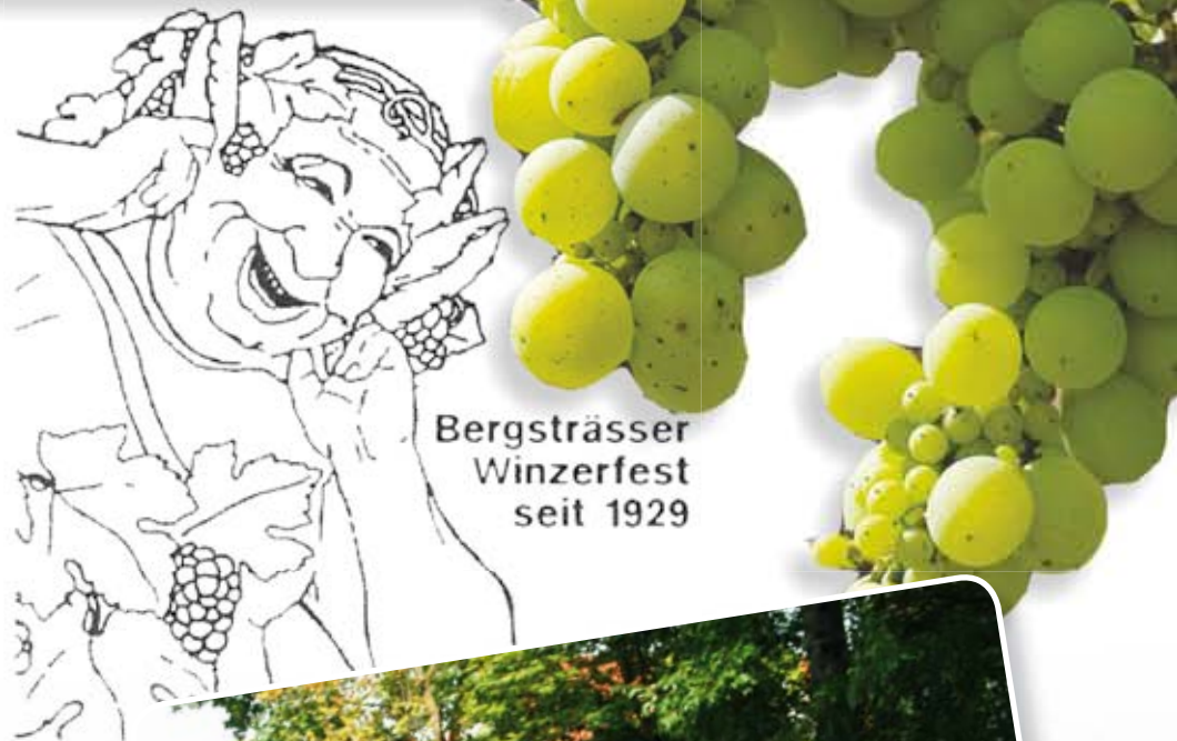
Bergsträsser Winzerfest seit 1929